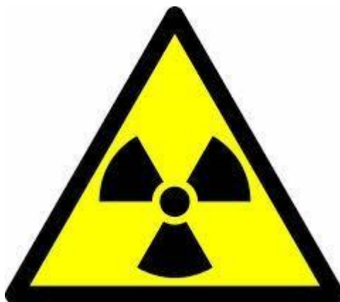
Figura 4 - Figura que representa o perigo radioativo